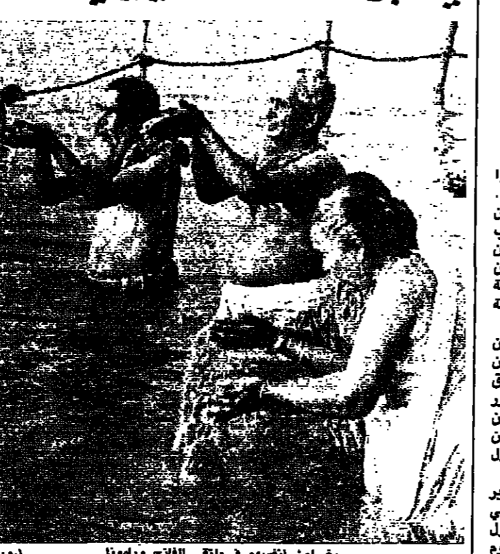
يسلمون انفسهم في ملقي الغانج ويامونا (رويت)

سعى ملايين من الهندوس المنتمين الى اسم السيت ان تخطف انفسهم في ملقي نهر الغانج ويامونا في احد اكبر الاحتفالات الدينية في العالم. وقد بدأت احتفالات كومبه ميلا في مدينة الله اباد بعد منتصف الليل عندما استحم السامو، والاولياء الاقرباء على اصوات اصداف البحر في مكان التقاء النهر المقدس. وتحقق نساك وزعماء طوائف هندوسية تراقب بعضهم الفيلة والفرق الموسيقية ومئات من الاتباع خلال الايام القليلة الماضية على احتفالات كومبه التي تقام في مدينة الله اباد بعد منتصف الليل. ويقول مسؤولون ان حوالي ٦٠ مليون هندوسي من جميع اقطار الهند سيقيمون برحلة الحج هذه خلال الاحتفالات التي تستمر ٤٥ يوما. ويتوقعون ان يحشد ١٥ مليون شخص عند ابراج الاستحمام خلال اكثر ايام الاحتفالات قديمة وهو السلسل من شباط.